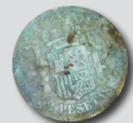
Txabolapea 1eko deshobiratzean aurkitutako 2 pezetako txanpona (Aranzadi Zientzia Elkarte)