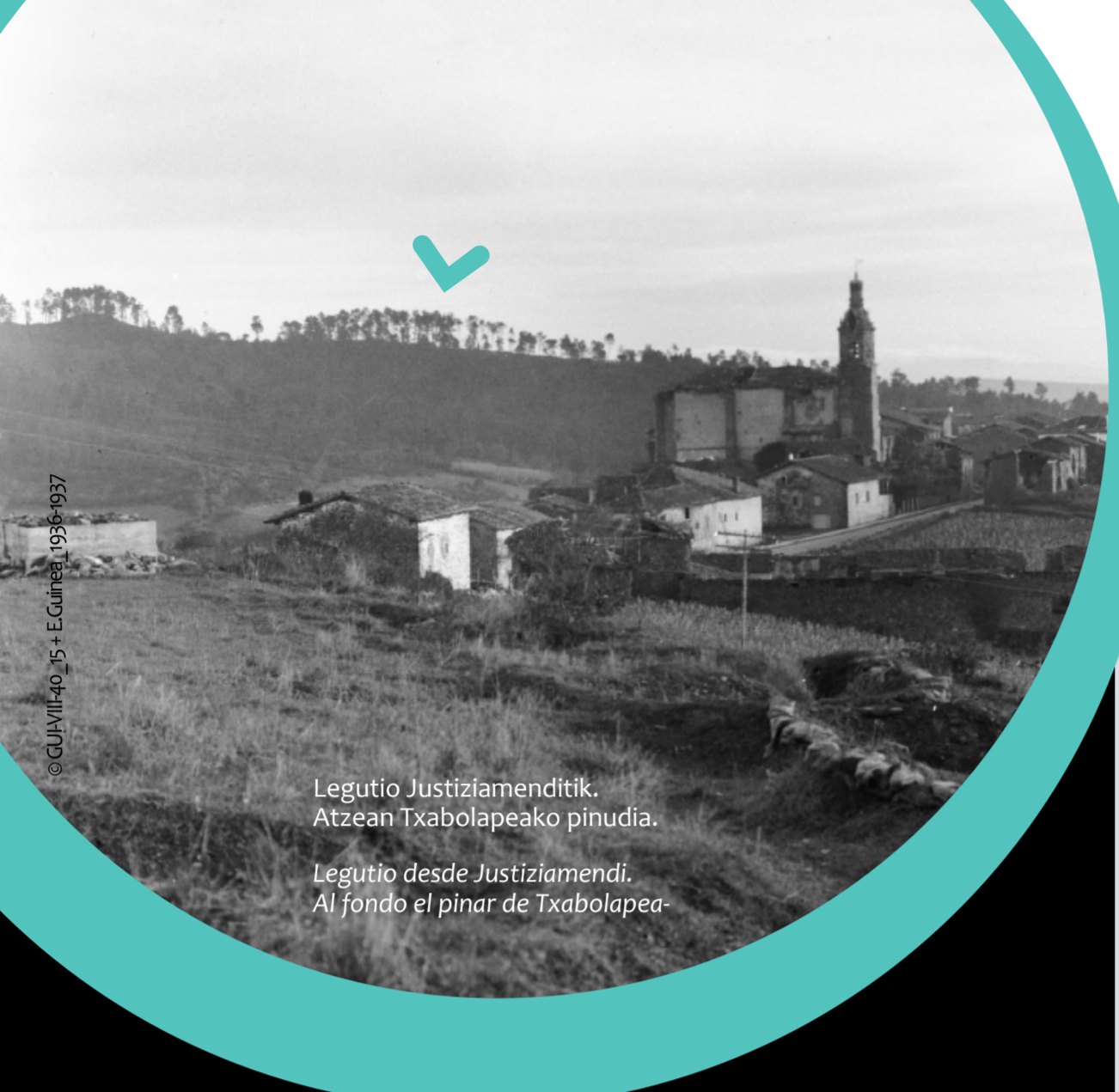
Legutio Justiziamenditik. Atzean Txabolapeako pinudia.