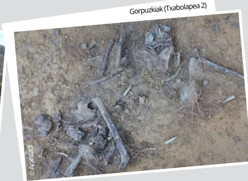
Gorpuzkiak (Txabolapea 2)