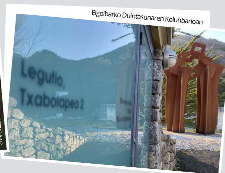
Elgoibarko Duintasunaren Kolunbarioan