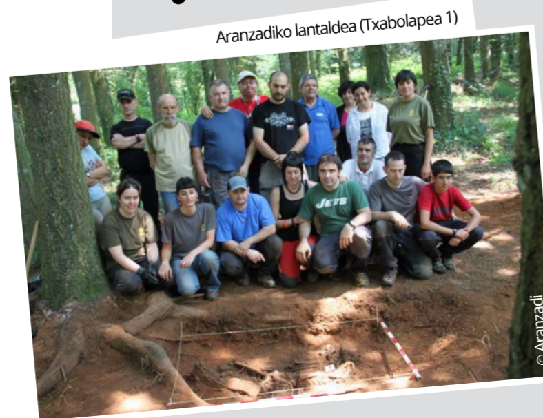
Aranzadiko lantaldea (Txabolapea 1)